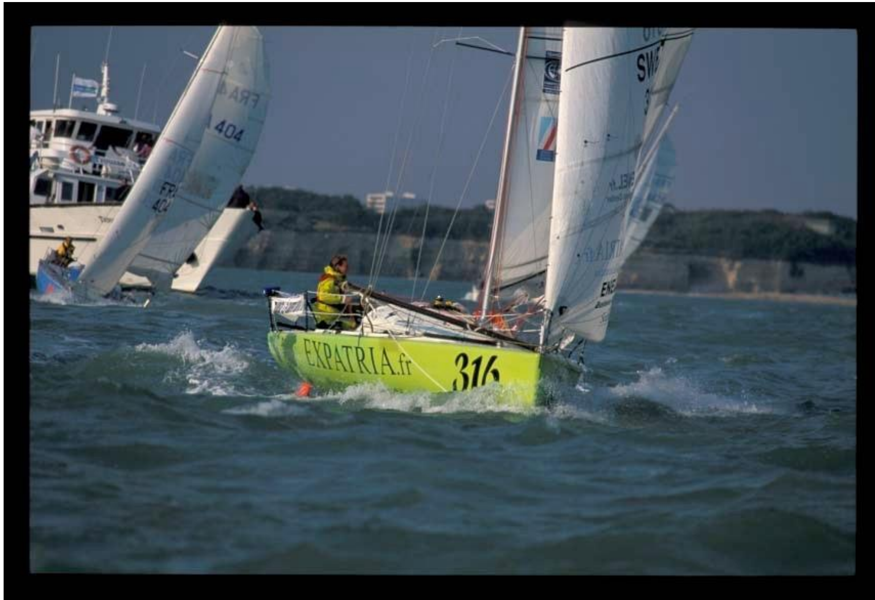
1350 Nm till Lanzarote - över Biscaya, förbi Finistère, längs Portugals kust.