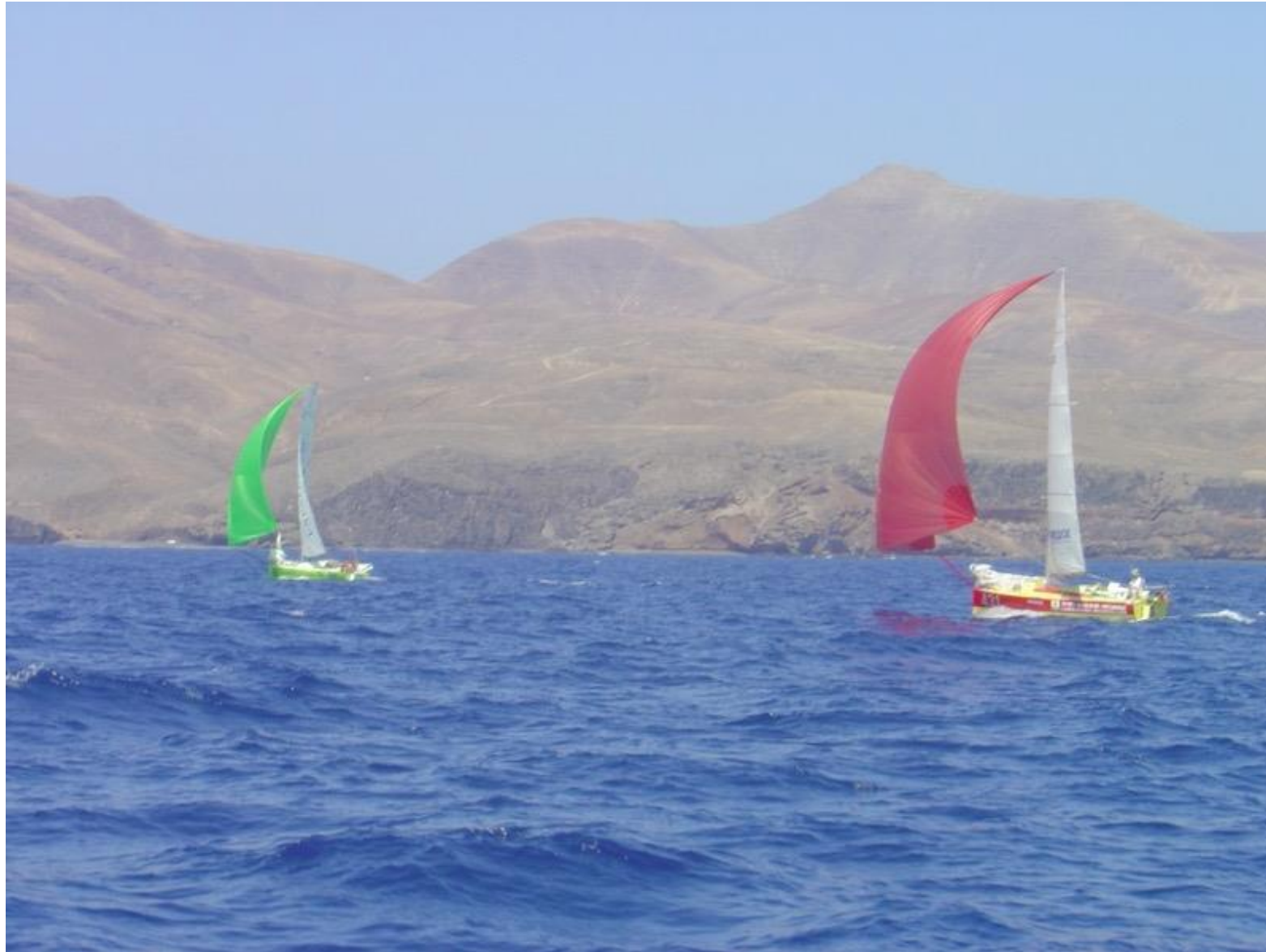
Etapp 2: Lanzarote - Salvador de Bahia, >3000 Nm. Start den 27 september 2003