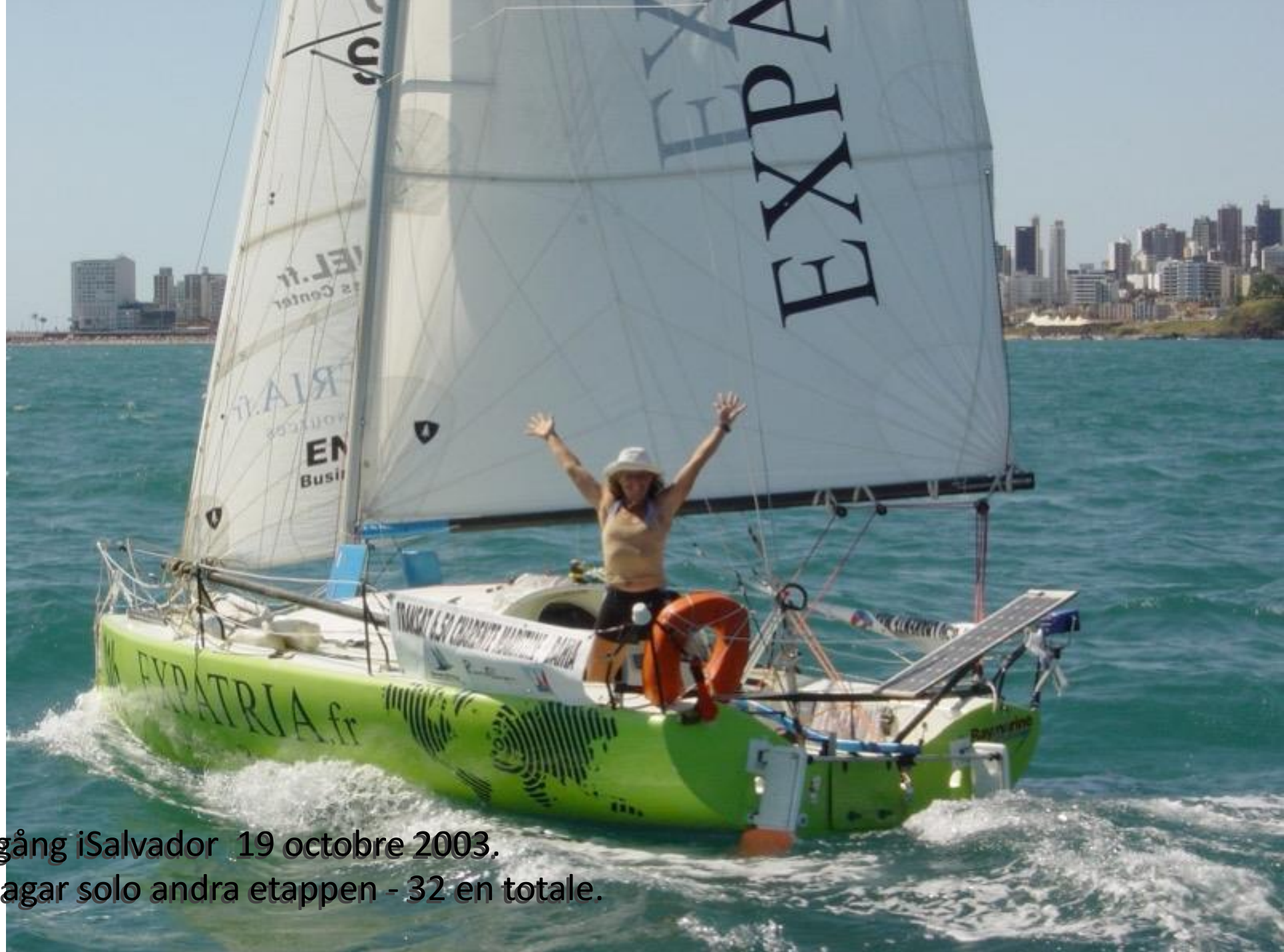
Målgång i Salvador 19 octobre 2003. 23 dagar solo andra etappen - 32 en totale.