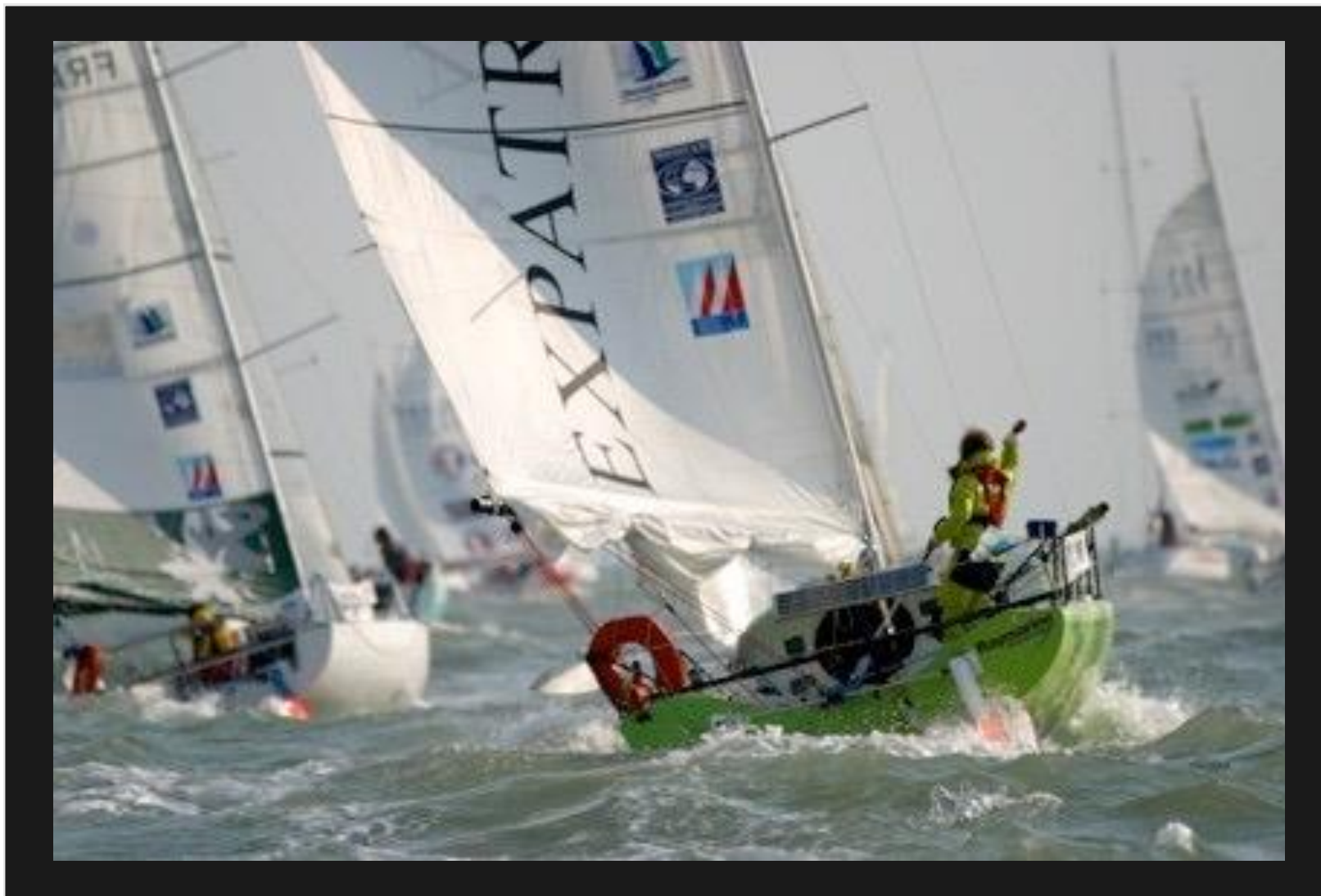
Start från La Rochelle den 9 september 2003