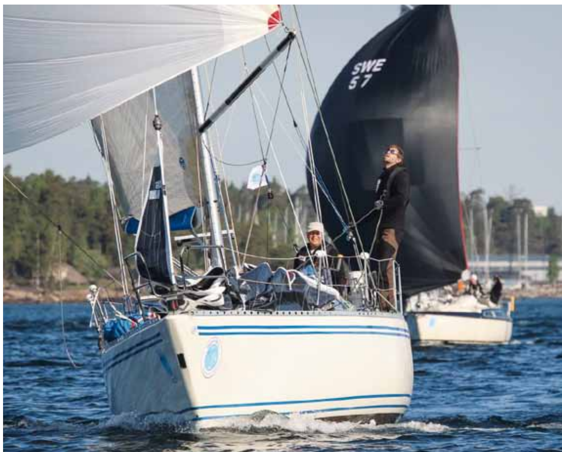
Starten i Oxelösund.