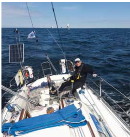
Sträckbog över till Visby.