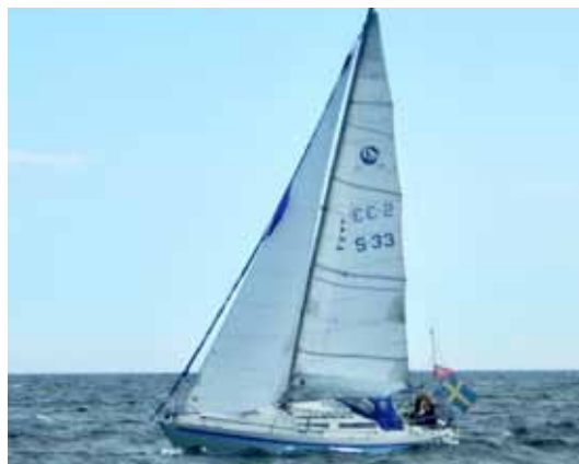
Gitsan i kuling på väg mot Sandhamn.

”Risken är minimal. Jag paddlar alltid nära land.”