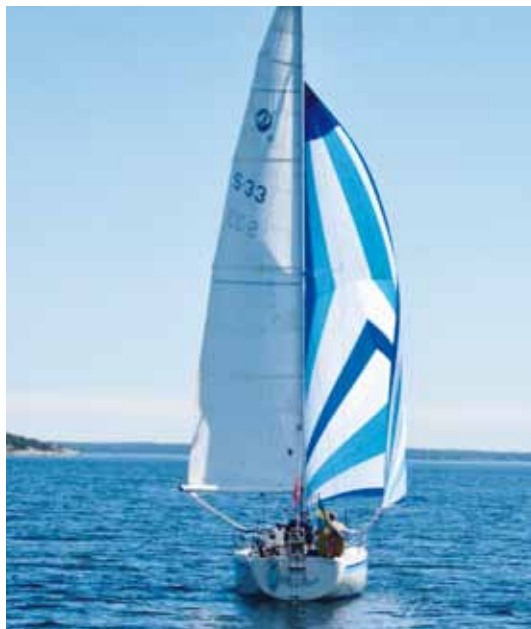
Gitsan på väg ut mot äventyret.

Tre båtar avseglade från Västerås, Gitsan (Facil 35), Rubina (Långedrag 41) och Albertina (Vindö 32). Vägen till Sandhamn gick via Baggensstaket och Napoleonviken, som blivit en tradition för oss genom åren att besöka för gemensamma måltider. I Sandhamn fyllde vi upp diesel, vatten och matförråden, duschade och åt en middag på värdshuset. Vin-